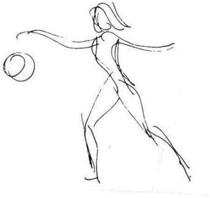
Björn Berg tecknade

Idlametoden tillämpas av både kvinnor och män, flickor och pojkar, unga och gamla, nybörjare och avancerade. Den lägger en grund till andra fysiska aktiviteter, inte minst idrottsliga. Den har därför en viktig uppgift när det gäller att motivera till fysisk träning och att ge barn och ungdom en rätt anpassad fysisk fostran.